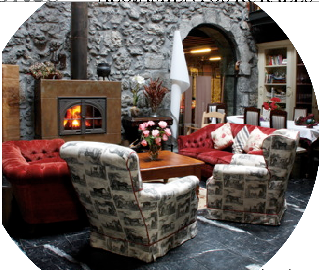
La zona de estar eran las antiguas carboneras.

Ansotegui. Ansotegui Errota, 15. Echevarría (Vizcaya). ☎ 902 10 38 92.