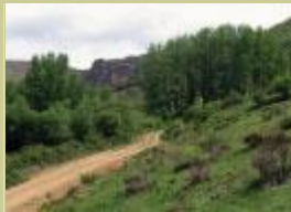
Hacia la peña del Castillo.

La senda del valle combina tramos con buen firme y otros más descarnados. El paseo de ida y vuelta recorre 9 km. Conviene llevar prismáticos.