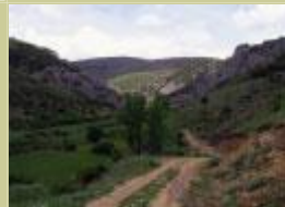
Entrada al valle.