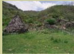
Chozo de pastores.