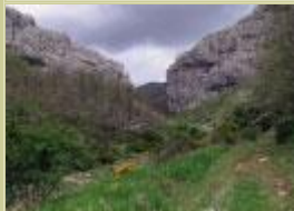
El Salto Cimero.