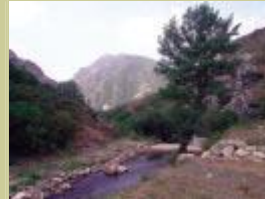
Valle del Casares.