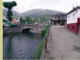
Geras de Gordón.