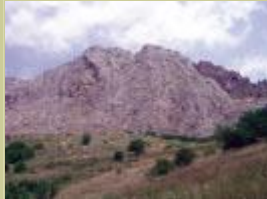
Paisaje de montaña.